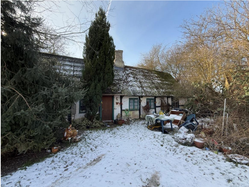
Bygaden 51, 4771 Kalvehave

Bindingsværkshus med tag af fibercement herunder asbest fra 1827 jf. BBR. Ejendommen er 68 m 2 beliggende på en 1.457 m 2 stor grund jf. BBR.