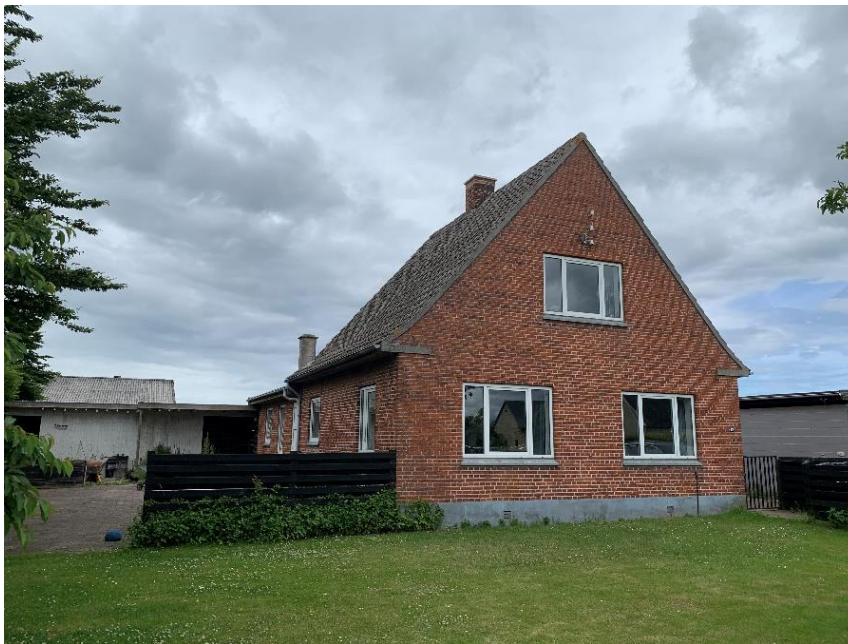
Bækvej 19, Radsted, 4990 Sakskøbing

Murstenshus med betontagsten fra 1944, med til-/ombygning i 2001 jf. BBR. Ejendommen er 162 m 2 og ligger på en 817 m 2 stor grund jf. BBR. Kælder på 5 m 2 jf. BBR, er dog ikke besigtiget.