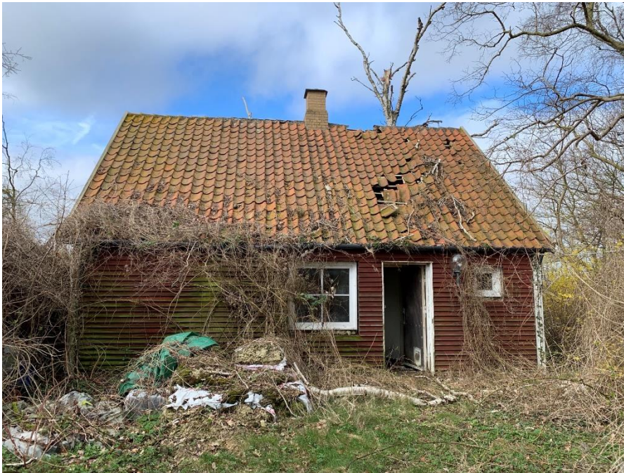
Nybyvej 43, 4863 Eskilstrup

Ejendom med et boligareal på 56 m 2 fra 1910, og ombygget 1962, jfr. BBR, beliggende på en 1206 m 2 stor grund. Ejendommen fremstår som træbeklædt og med tegltag, (stemmer dog ikke overens med BBR, idet det står anført som murstensejendom).