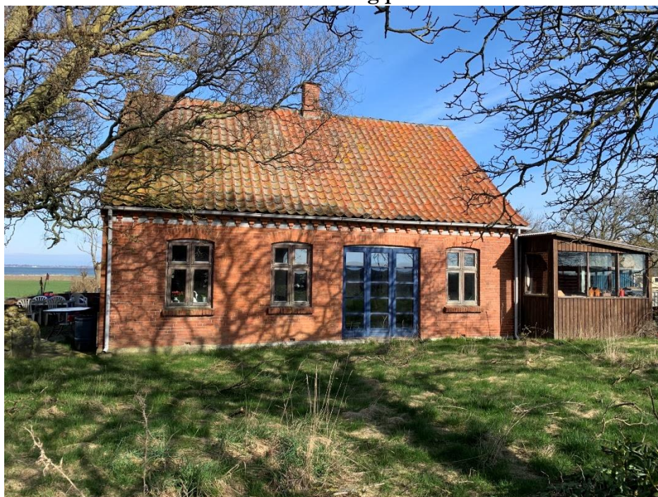
Konemadevej 30, 4942 Askø

Murstenshus med tegltag fra 1908 jf. BBR. Ejendommen er 94 m 2 og ligger på en 1.636 m 2 grund. På grunden ligger også jf. BBR et 20 m 2 udhus af mursten og tegl.